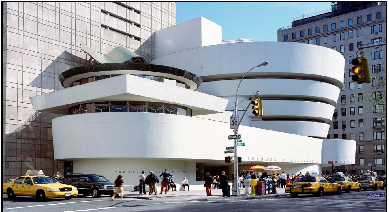
FIGUUR 10a: Frank Lloyd Wright, Guggenheim Museum , New York, 1956.