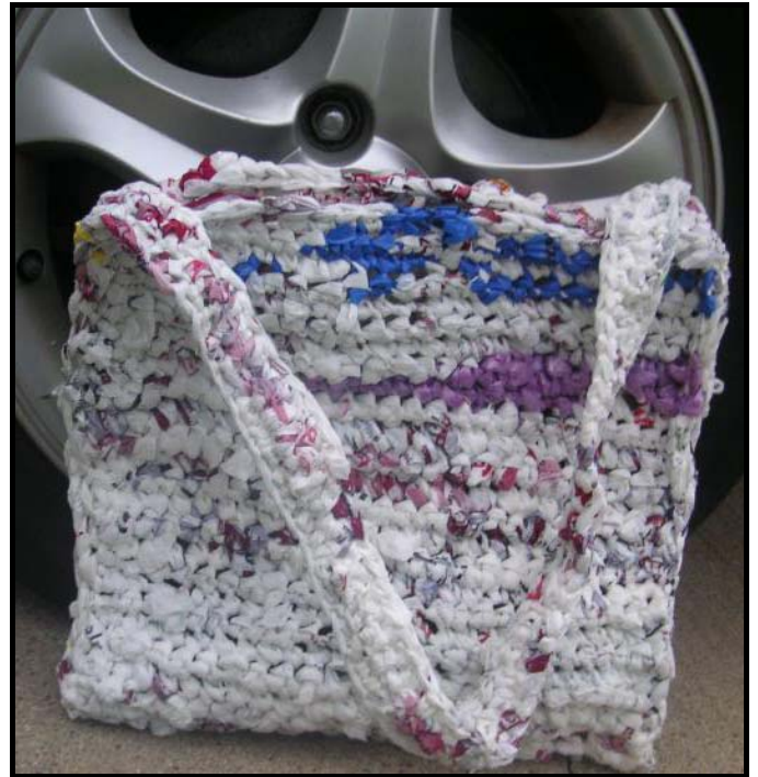
FIGUUR 4b: Sak , gemaak uit plastieksakke.