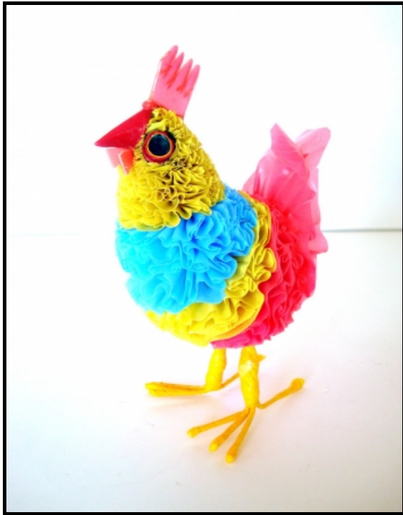
FIGUUR 4a: Hoender , gemaak uit plastieksakke.