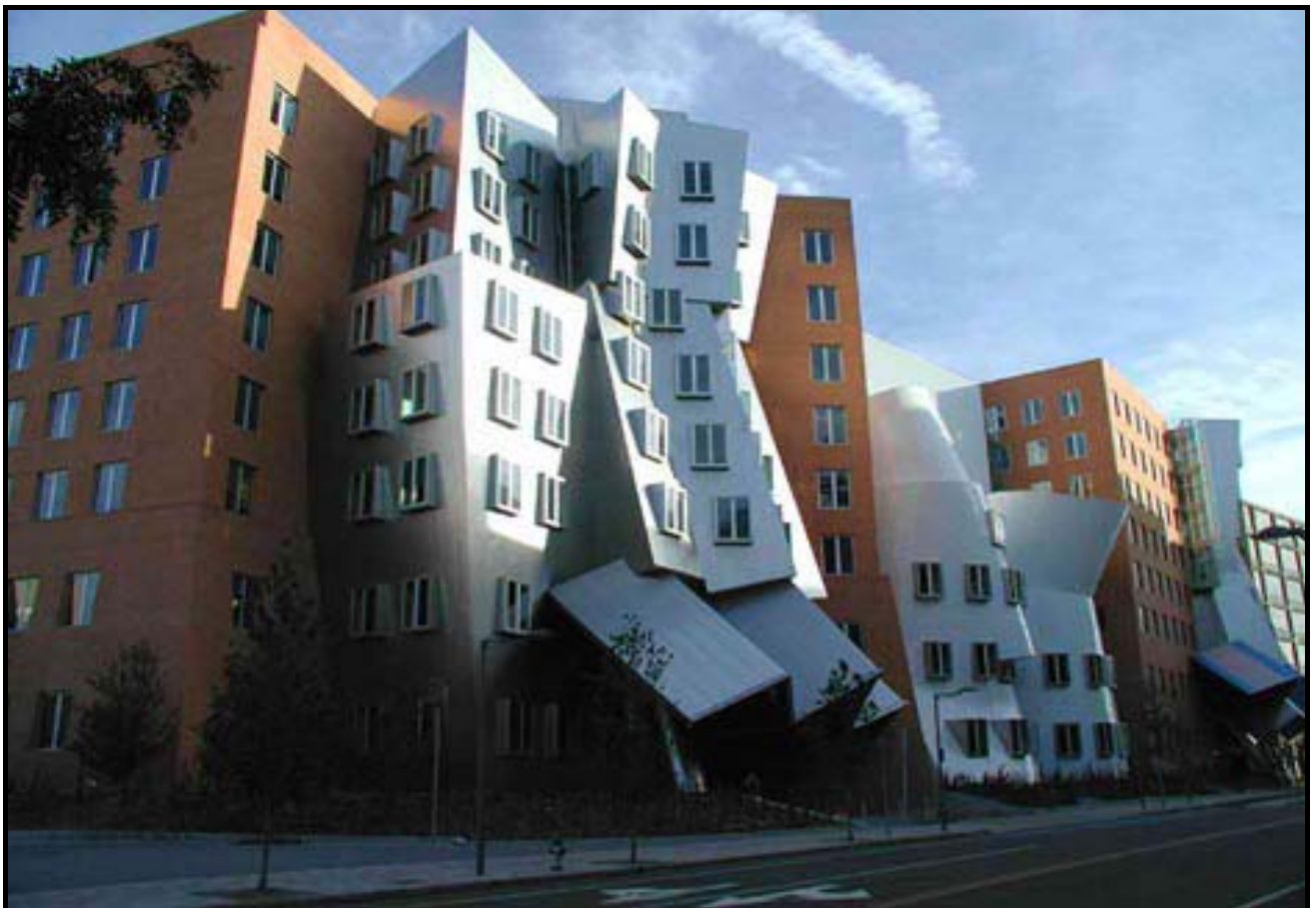
FIGUUR 10b: Frank Gehry, Die Stata-sentrum , Massachusetts, 2004.