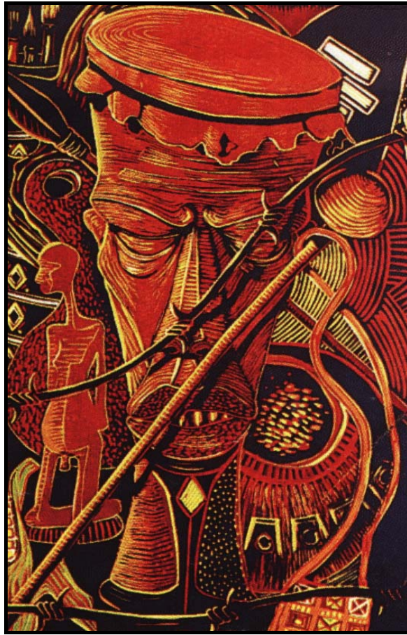
FIGUUR 6a: Henry de Leeuw, Artists in isolation (Kunstenaars in isolasie) , gekleurde linoosnee, 1988.