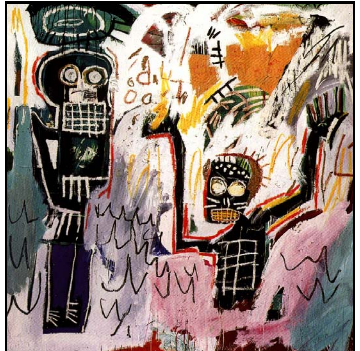
FIGUUR 7b: Jean Michel Basquiat, Untitled (Baptism) (Ongetiteld (Doo)) , akriëlverf, olieverb en papiercollage op doek, 1982.