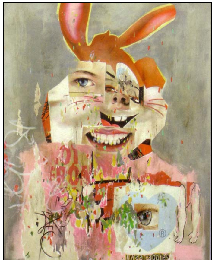
FIGUUR 7d: Asha Zero, Zansi nib , akriëlverf op bord, 2008.