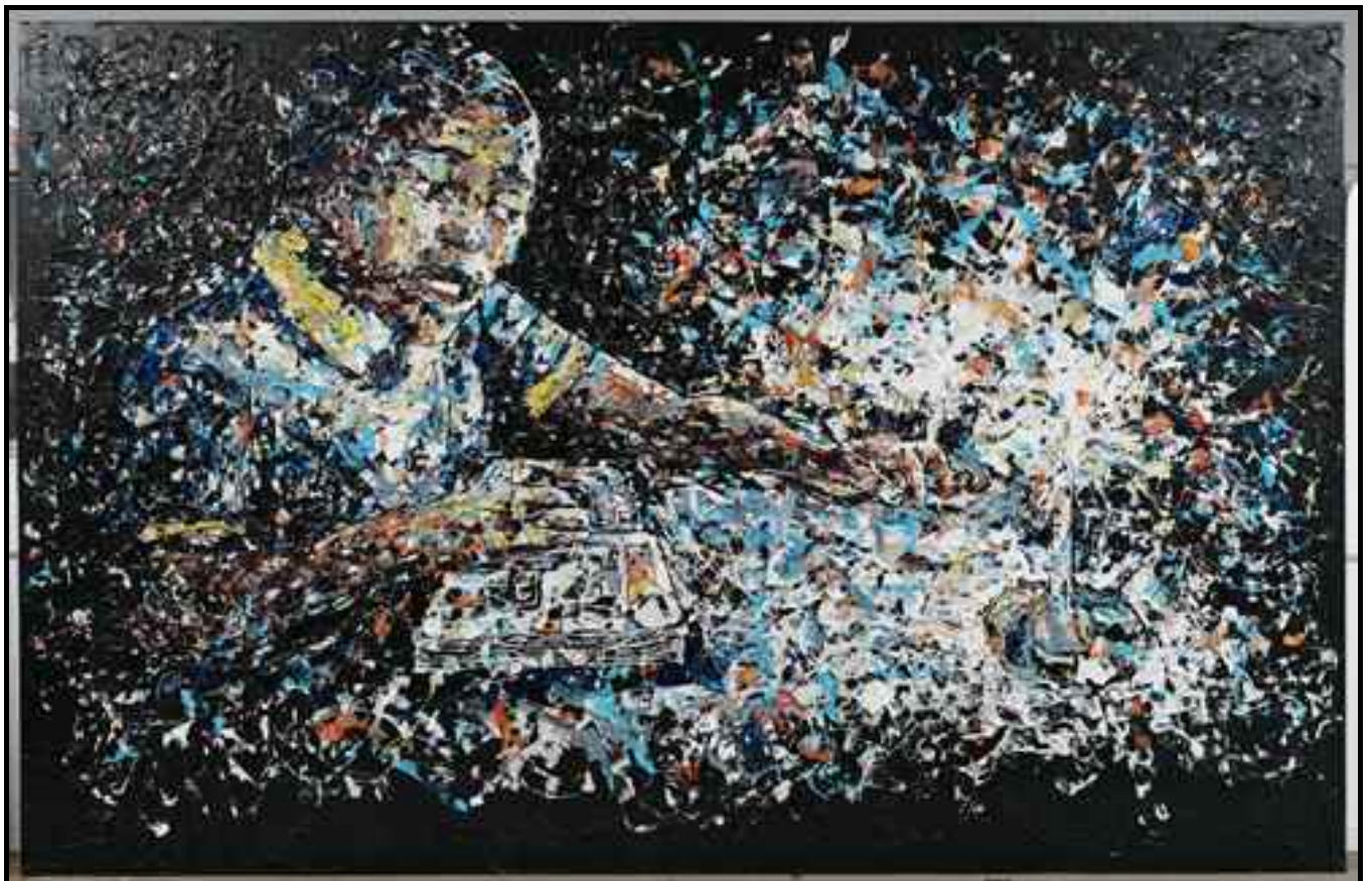
FIGUUR 4c: Mbongeni Buthelezi, Girl with candle (Meisie met kers) , plastiek op plastiek, 2007.

Suid-Afrikaanse kunstenaar, Mbongeni Buthelezi, kan 'n 'skilder in plastiek' genoem word omdat hy lae gekleurde plastiek opbou deur dit met 'n hittegeweer saam te smelt.