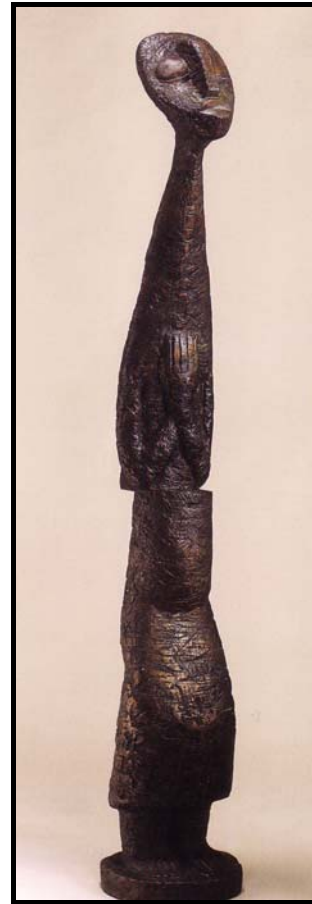
FIGUUR 2b: Sydney Kumalo, Praying woman ( Biddende vrouw ), brons, 1950.