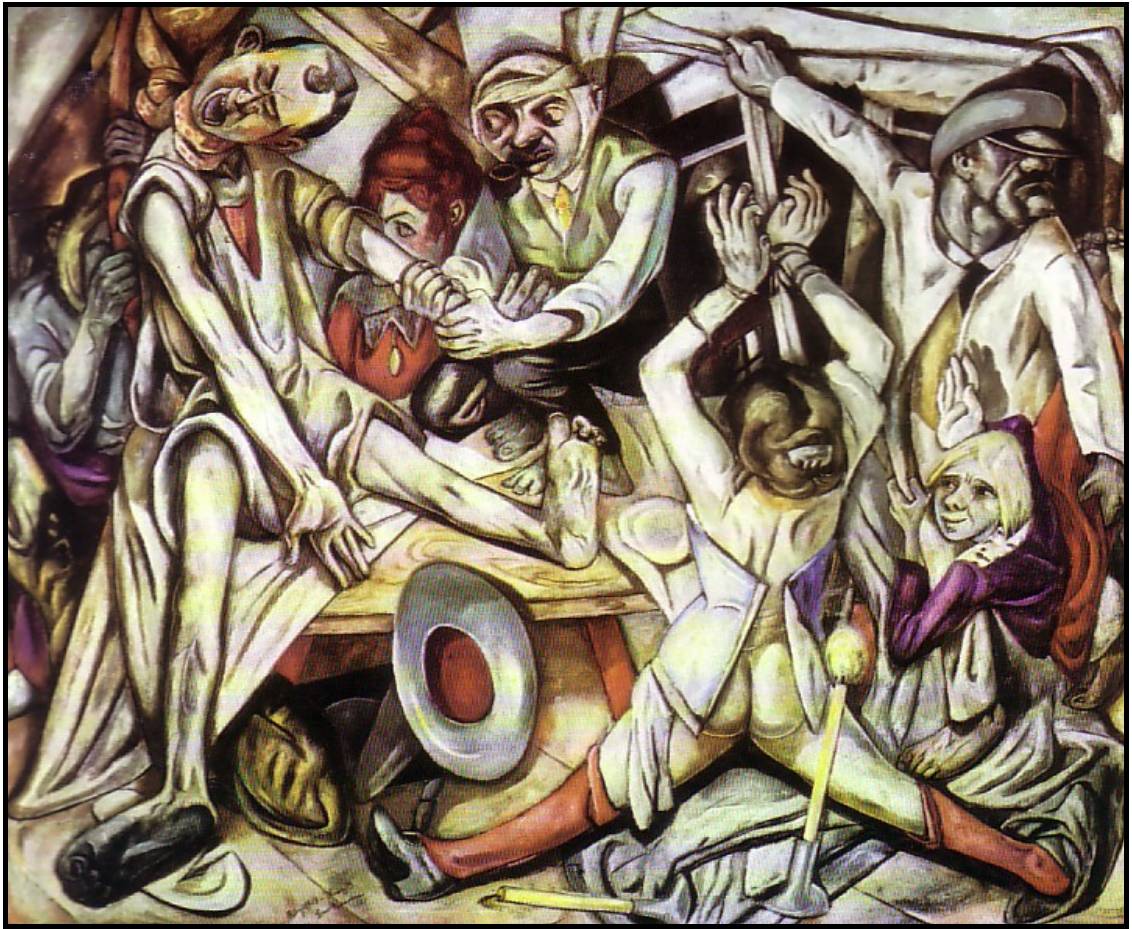
FIGUUR 1a: Max Beckmann. The night (Die nag) , olieverf op doek, 1918 – 1919.