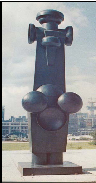
FIGUUR 2c: Edoardo Villa, Vertical IV ( Vertikale IV ), brons, 1968.