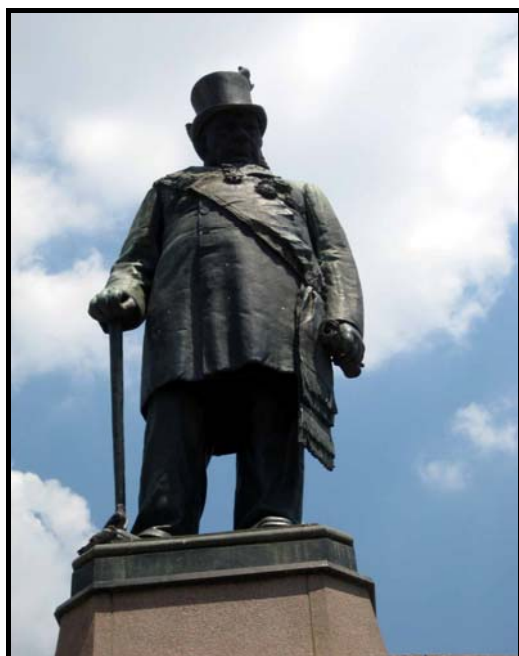
FIGUUR 5b: Anton van Wouw, Standbeeld van Paul Kruger , brons, 1919.

Die standbeelde van Suid-Afrika se vier ontvangers van die Nobel Vredesprys deel 'n breë platvorm in die V&A Waterfront in Kaapstad. Teks, gegraveer in die plaveisel in die 11 amptelike tale van Suid-Afrika, vloei vanaf die voete van elke figuur, en noem en dateer eers hulle toekennings, en haal dan een van elkeen se bekendste stellings aan.