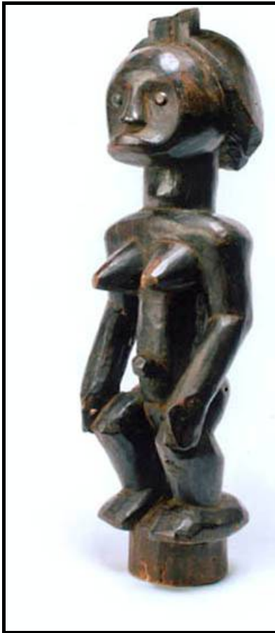
FIGUUR 2a: Fang ancestral figure ( Fang voorouer-figuur ), houtsneewerk, geen datum.