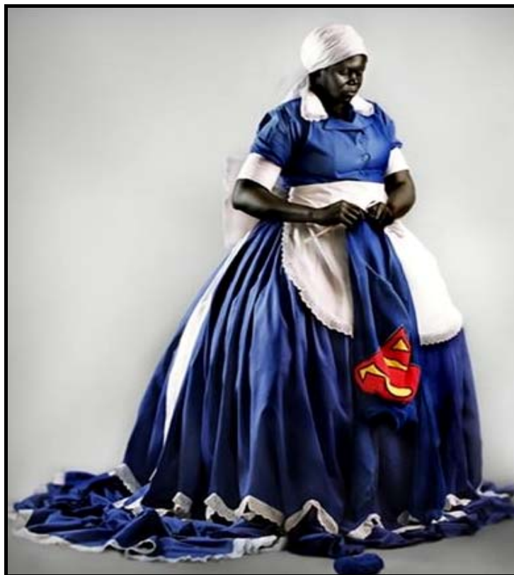
FIGUUR 9b: Mary Sibande, They don't make them like they used to (Hulle maak dit nie meer soos hulle eers gedoen het nie) . Opvoer- ('Performance') stuk met die kunstenaar aangetrek en voorgestel in 'n uitstalruimte, 2009.