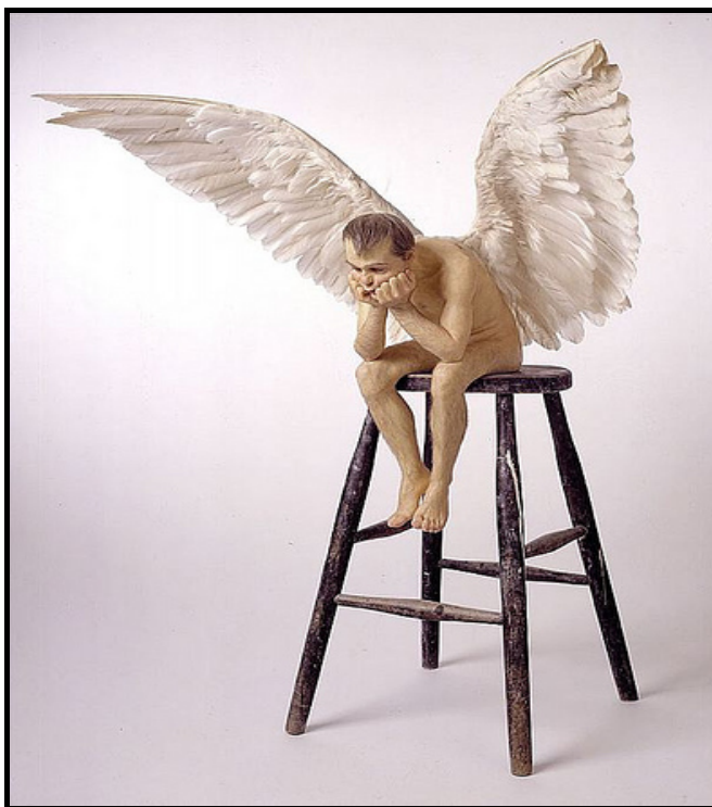
FIGUUR 8b: Ron Mueck, Angel (Engel) , beeldhouwerk gemaak uit silikonrubber en gemengde media, 1997.