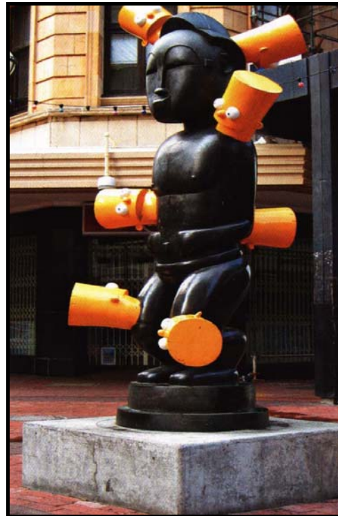
FIGUUR 2d: Brett Murray, Africa ( Afrika ), geverfde brons, 2000.