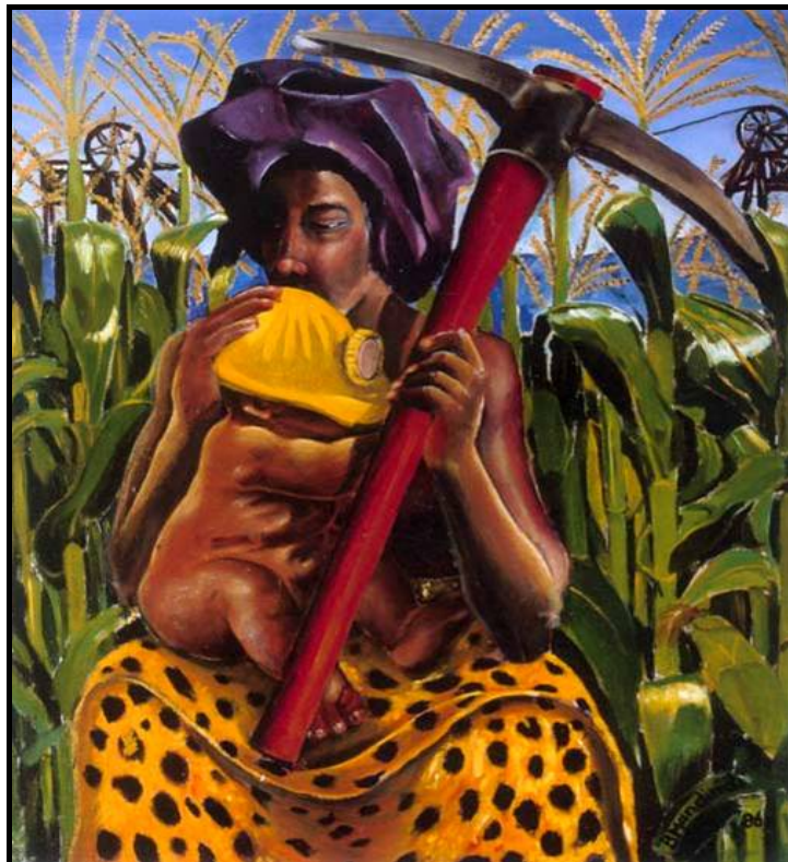
FIGUUR 6b: Billy Mandindi, African Madonna (Afrika-Madonna) , olieverf op doek, 1986.