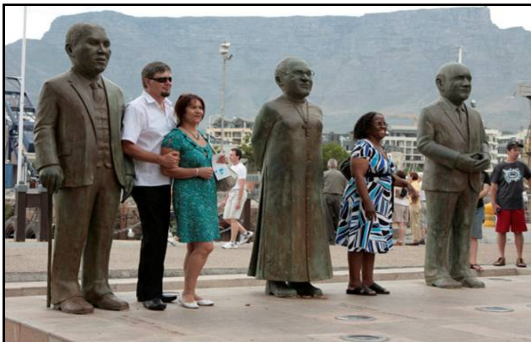
FIGUUR 5a: Claudette Schreuders, Statues on Nobel Square (Standbeelde op Nobel Square) , (detail) V&A Waterfront in Kaapstad, brons, 2005.

Die standbeelde van Suid-Afrika se vier ontvangers van die Nobel Vredesprys deel 'n breë platvorm in die V&A Waterfront in Kaapstad. Teks, gegraveer in die plaveisel in die 11 amptelike tale van Suid-Afrika, vloei vanaf die voete van elke figuur, en noem en dateer eers hulle toekennings, en haal dan een van elkeen se bekendste stellings aan.