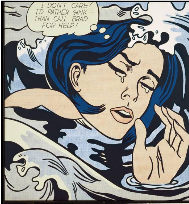
FIGUUR 7a: Roy Lichtenstein, Drowning girl (Verdrinkende meisie) , akriëlverf op doek, 1963.