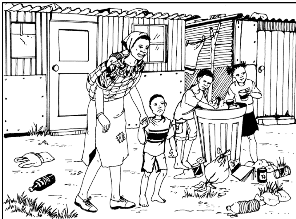
[Polelo ke lehumo, M Maja le ba bangwe]