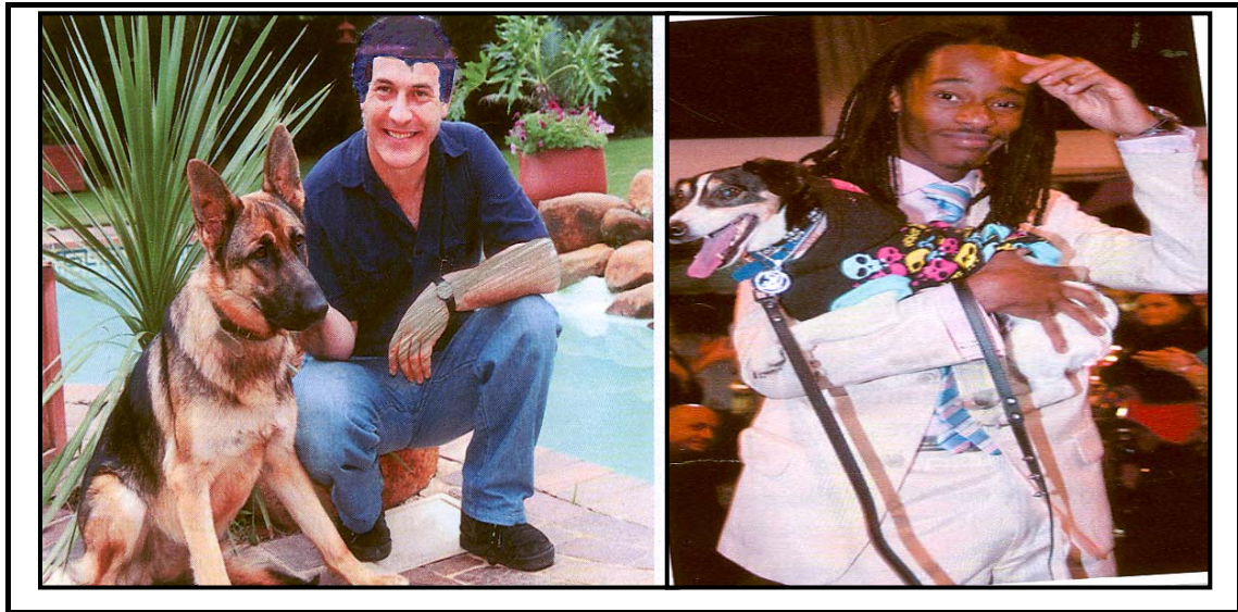
[Your Family: Matšhe 2009]

1.6 Lekodišiša diswantšho tše gomme o ngwale taodišo ka tšona.