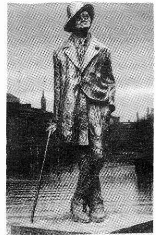
● JAMES JOYCE (AN SEOIGHEACH)

gurbh fhiú dóibh pictiúrlanna a oscailt in Éirinn. Tugadh slám airgid don Seoigheach, d'fhág sé Trieste agus bhain Baile Átha Cliath, a chathair dhúchais féin, amach ar an 21ú Deireadh Fómhair, 1909. Suíomh feiliúnach do phictiúrlann nua a bhí uaidh. Chuardaigh sé cuid mhór áiteanna sa phríomhchathair, agus faoi dheireadh shocraigh sé ar an bhfoirgneamh, Uimhir a 45, Sráid Mhuire, a cheannach. Chuir sé fios láithreach ar a chairde i Trieste agus chuaigh siad gan mhoill i mbun pictiúrlann a dhéanamh as an bhfoirgneamh i Sráid Mhuire. Bhí go leor deacrachtaí le sárú - ní dheachaigh an Seoigheach féin a luí roimh a trí a chlog oíche ar bith ó thosaigh an obair athchóirithe. É féin a rinne na postaeirí fiú amháin do lá na hoscaite!"