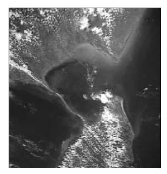
நாசாவால் வெளியிடப்பெற்றதும் இந்தியாவுக்கும் இலங்கைக்கும் இடையில் உள்ளதுமான புராதன பாலத்தின் படம்

உள்ளன. பெரும்பாலும் இக்குடியிருப்புக்கள் 300 000 வருடங்கள் பழைமையானவை ஆகவும் இருக்கலாம். சிலவேளைகளில் இற்றைக்கு 500 000 வருடங்களுக்கும் முந்தியதாகவும் அமைந்திருக்கக்கூடும்.